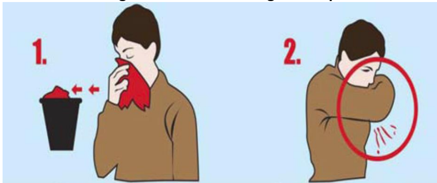
Figura 2.- Método de higiene respiratoria